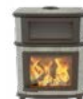
Grande Nobles Gourmet Naturel