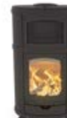
Eclips Gourmet Uni Noir