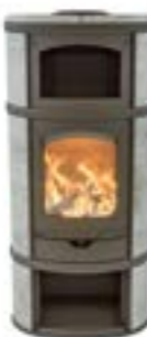
Eclips Complet Naturel