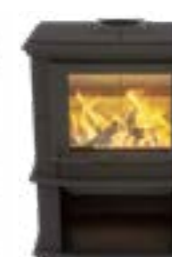
Nobles Depot Uni Noir