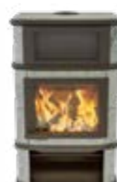
Grande Nobles Complet Naturel