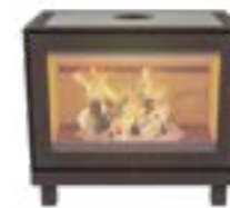
Max W avec pieds Naturel