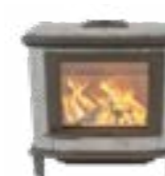
Nobles Basis Naturel