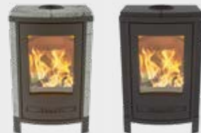
Torus avec pieds Naturel