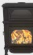
Vision Cook Uni Noir