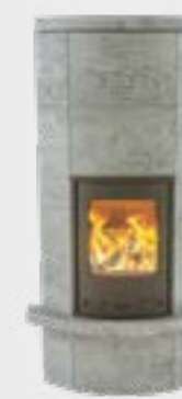
Massiv Grande avec Rebord à cendres