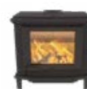
Nobles Basis Uni Noir