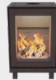
Max H avec pieds Uni Noir