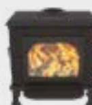
Vision Basis Uni Noir