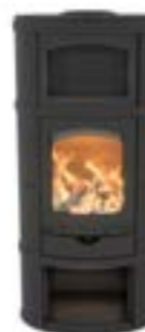
Eclips Complet Uni Noir