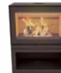
Max W Depot Uni Noir