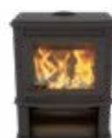
Grande Nobles Depot Uni Noir