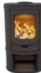
Eclips Depot Uni Noir