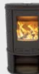
Ecosy Depot Uni Noir