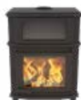
Grande Nobles Gourmet Uni Noir