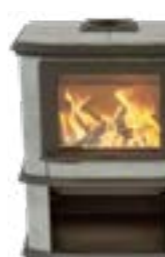
Nobles Depot Naturel