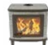
Grande Nobles Basis Naturel