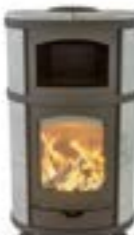
Eclips Gourmet Naturel