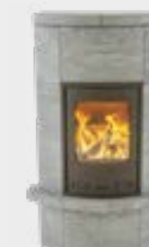
Massiv avec Rebord à cendres