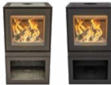
Max B Depot Naturel