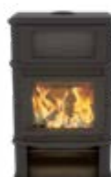
Grande Nobles Complet Uni Noir