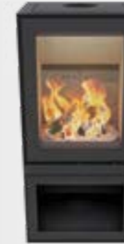
Max H Depot Uni Noir