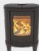
Ecosy Basis Uni Noir