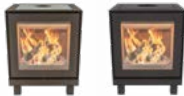
Max B Naturel

Le Max est une nouvelle série élégante de poêles à bois composée de deux modèles différents. Lors de la conception de cette série, le choix s'est porté sur la pierre stéatite en combinaison avec un cadre en acier. Ce cadre en acier et la pierre ollaire encastrée donnent à la série Max le design le plus élégant de tous les poêles en pierre ollaire.