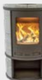
Ecosy Depot Naturel