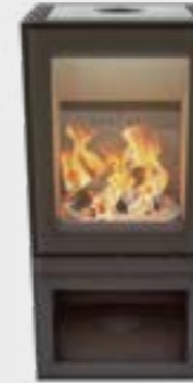
Max H Depot Naturel