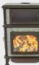
Vision Cook Naturel