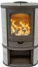
Eclips Depot Naturel