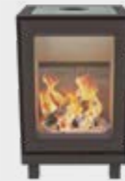
Max H avec pieds Naturel