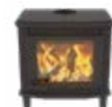
Grande Nobles Basis Uni Noir