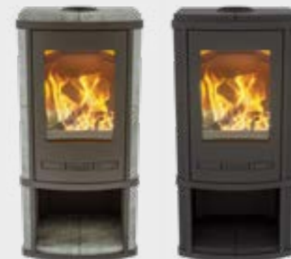
Torus Depot Naturel