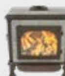
Vision Basis Naturel

Cuire une pizza ou cuisiner sur un feu de bois? Le Vision Cook est un poêle, une cuisinière et un four en un. Cela signifie un triple plaisir.