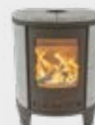
Ecosy Basis Naturel