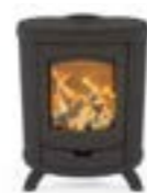
Eclips Basis Uni Noir