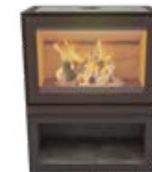
Max W Depot Naturel