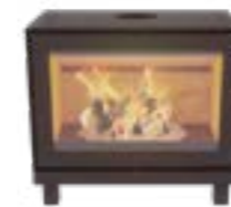
Max W avec pieds Noir