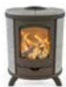
Eclips Basis Naturel