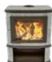
Grande Nobles Depot Naturel