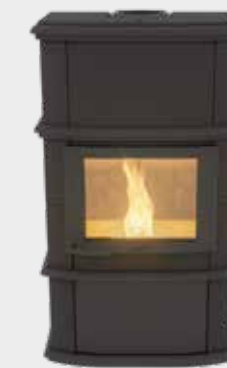
Nobles Pellet Plus Uni Noir