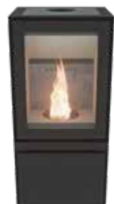
Max H Pellet Naturel