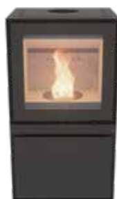
Max B Pellet Uni Noir