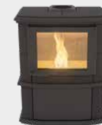
Nobles Pellet Uni Noir