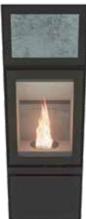
Max H Plus Naturel