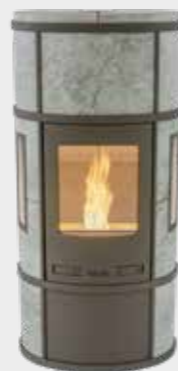
Ecosy Pellet Plus Naturel