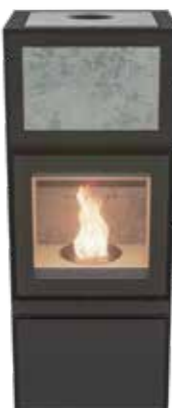
Max B Pellet Plus Naturel