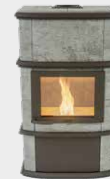
Nobles Pellet Plus Naturel