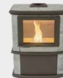
Nobles Pellet Naturel