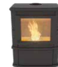
Grande Nobles Pellet Uni Noir