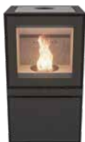
Max B Pellet Naturel