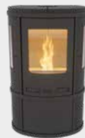
Ecosy Pellet Uni Noir