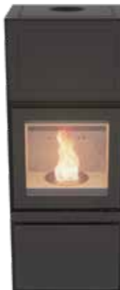
Max B Pellet Plus Uni Noir