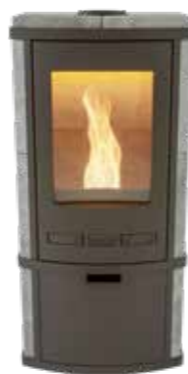
Torus Pellet Naturel