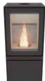
Max H Pellet Uni Noir