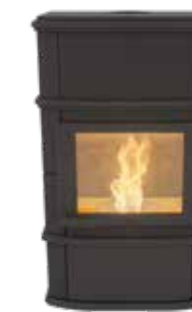
Grande Nobles Plus Pellet Uni Noir