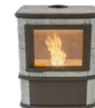
Grande Nobles Pellet Naturel