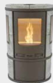
Ecosy Pellet Naturel