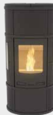
Ecosy Pellet Plus Uni Noir