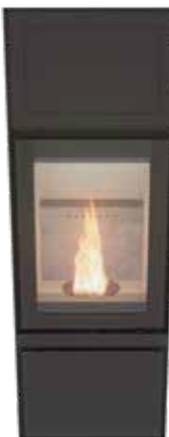
Max H Plus Uni Noir