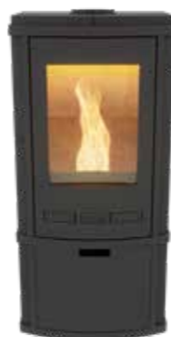
Torus Pellet Uni Noir