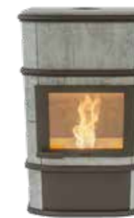
Grande Nobles Plus Pellet Naturel